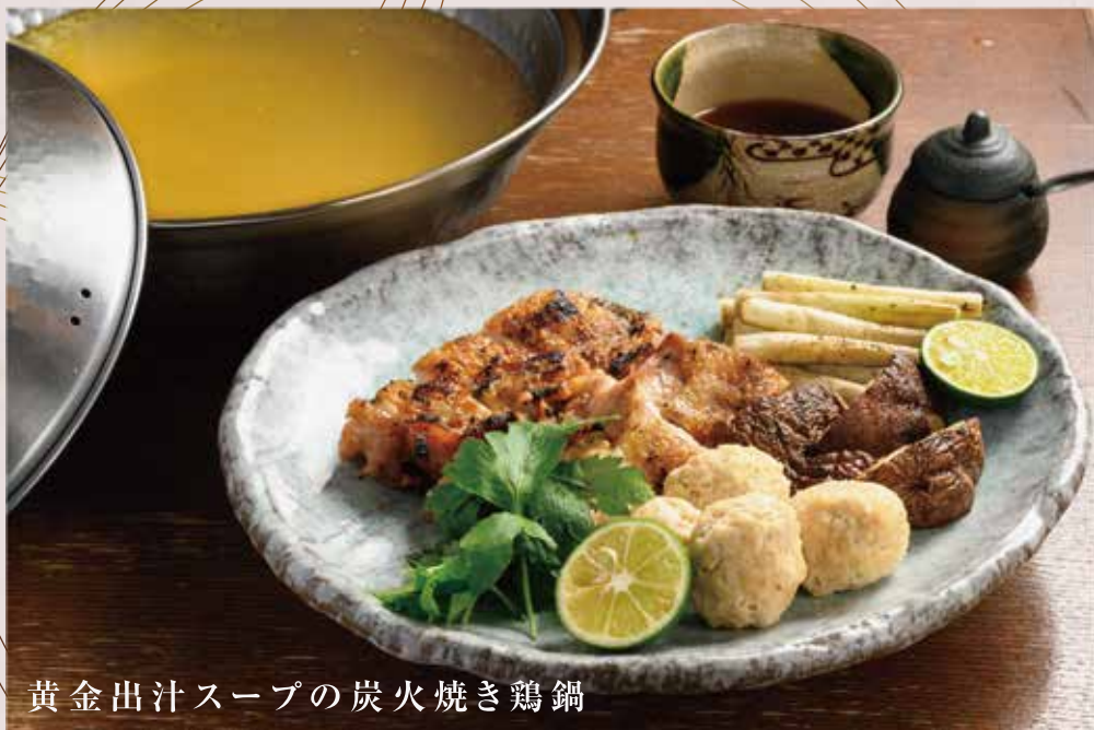
黄金出汁スープの炭火焼き鶏鍋