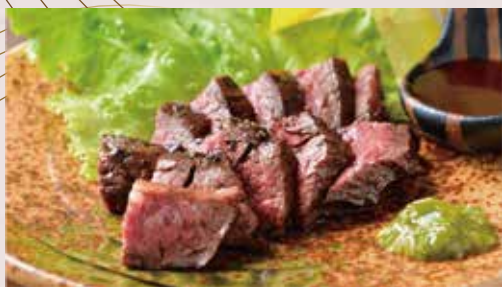
道内産和牛ステーキ